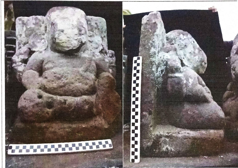
Arca Ganesha (Tampak Depan)